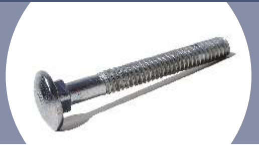
Tabela de Dimensões

Dimensões - ANSI B 18.5 Rosca - ANSI B 1.1